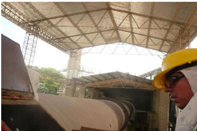
Imag. 3: Aplicação de REWITEC com o forno em funcionamento

REWITEC® foi aplicado manualmente diretamente na coroa dentada. Durante a aplicação do produto, o forno funcionava normalmente, e o processo de aplicação demorou 3 semanas.